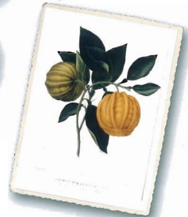
Citrus Aurantium Striatum ( Arancio Scannellato ), aus Targioni Tozzetti, 1825