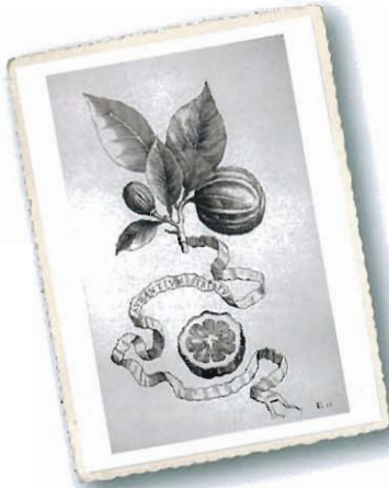
Arantium striatum , aus Ferrari, 1646