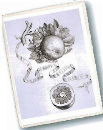
Aurantium crispo folio , aus Ferrari, 1646