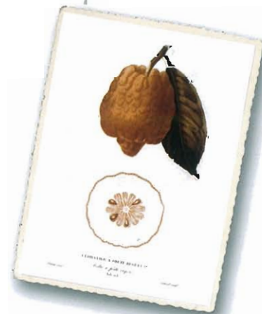
Cedratier a fruit rugueux (Cedro a frutto rugoso), aus Risso e Poiteau, 1818