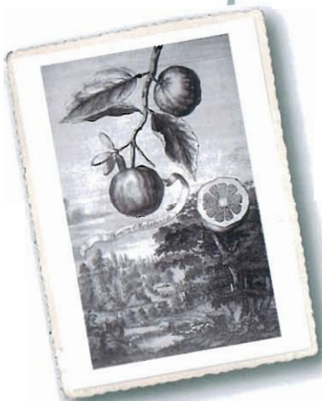
Limon Mellarosa , aus Volkamer, I, 1708

Eine kleinwüchsige Pflanze, kompakt und sehr produktiv; sie hat dichte Blätter, länglich, mit abgerundeter Spitze und manchmal mit leicht gezahntem Rand. Die Blüten sind mittelgroß, duftend, weiß oder leicht violett, hauptsächlich in Gruppen angeordnet. Die Früchte sind kugelig, an den Enden abgeflacht, längsgefurcht und mit dünner Schale, zitronengelb, bei Vollreife orange. Saftreiches Fleisch, angenehm sauer, ohne Kerne.