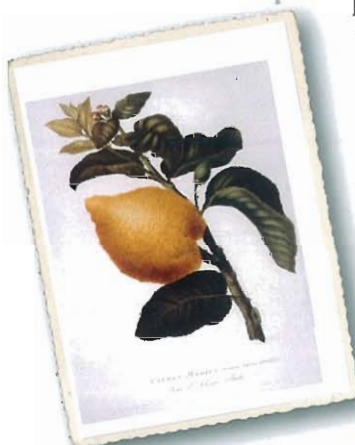
Citrus Medica Pomum Adami citratum ( Pomo d'Adamo cedrato ), aus Targioni Tozzetti, 1825

Alte Sorte, schon in den Medici-Gärten des 17. Jh. s, wahrscheinlich eine Hybride zwischen Zedrat-Zitrone und Bitterorange.