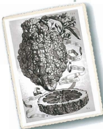
Lima citrata oblonga sive scabiosa et mostrosa , aus Ferrari, 1646