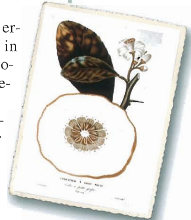
Cedratier a gros fruit ( Cedro a frutto grosso ), aus Risso e Poiteau, 1818

Wir finden diese Sorte bei Riccobono erwähnt in einer Monografie von 1899, in der sämtliche Agrumenvarietäten des Botanischen Gartens von Palermo aus dieser Zeit beschrieben werden.