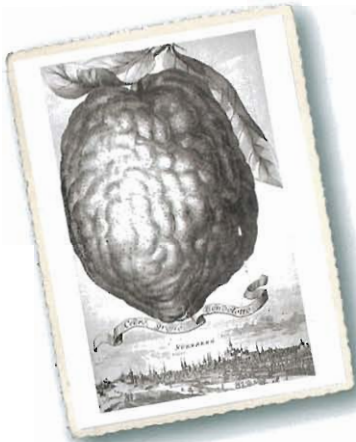
Cedro grosso Bondolotto , aus Volkamer, I, 1708