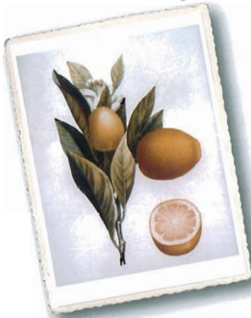
Oranger a fruit oblong ( Arancio a frutto bislungo ), aus Risso e Poiteau, 1818

Sie wurde von Risso 1818 beschrieben, aber ihr Ursprung ist unklar; morfologisch könnte es sich um eine Kreuzung zwischen Orange und Zitrone handeln.